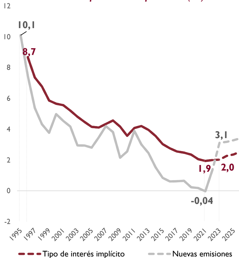
Condiciones de Financiación de la deuda pública española (%)