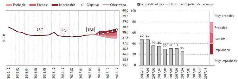
GRÁFICO 2. RECURSOS TOTAL ADMINISTRACIONES PÚBLICAS