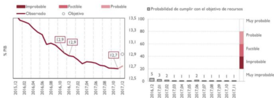
GRÁFICO 2. RECURSOS NO FINANCIEROS