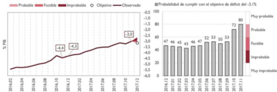
GRÁFICO 1. DÉFICIT TOTAL ADMINISTRACIONES PÚBLICAS