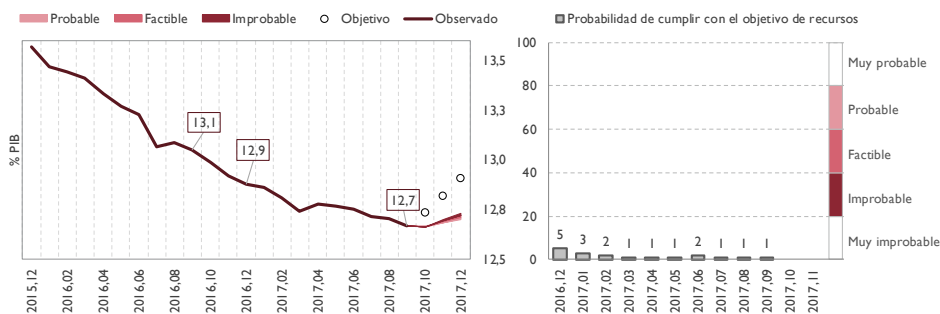
GRÁFICO 2. RECURSOS NO FINANCIEROS