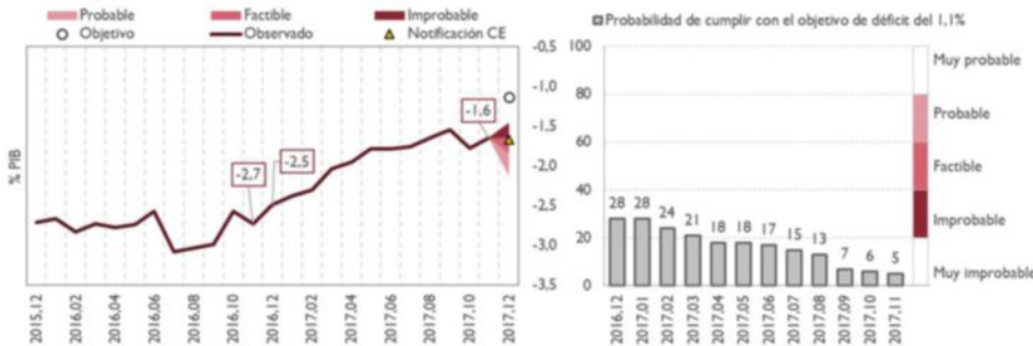
GRÁFICO 1. CAPACIDAD O NECESIDAD DE FINANCIACION

(*) La segunda notificación del déficit y deuda del 30 de septiembre enviada a la Comisión Europea incluyó una previsión de cierre para 2017 que reflejaba un déficit del 1,7% del PIB para la Administración Central, dos décimas por encima de lo comunicado en marzo.