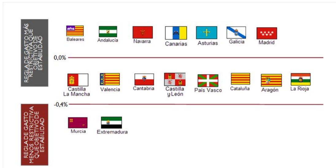
GRÁFICO. SALDO EXIGIDO EN 2018 POR APLICACIÓN DE LA REGLA DE GASTO RESPECTO AL OBJETIVO DE ESTABILIDAD (% PIB)

De acuerdo con lo anterior, la contribución del subsector CCAA al cumplimiento de los compromisos asumidos por España en la Actualización del Programa de Estabilidad (APE) 2017-2020 y en el marco del Procedimiento de Déficit Excesivo (PDE) será previsiblemente superior al contemplado en dicho documento, en la medida en que el cumplimiento de la regla de gasto, unido a la evolución anunciada de los recursos del sistema de financiación en 2018, podría llevar al subsector a una situación próxima al equilibrio presupuestario.